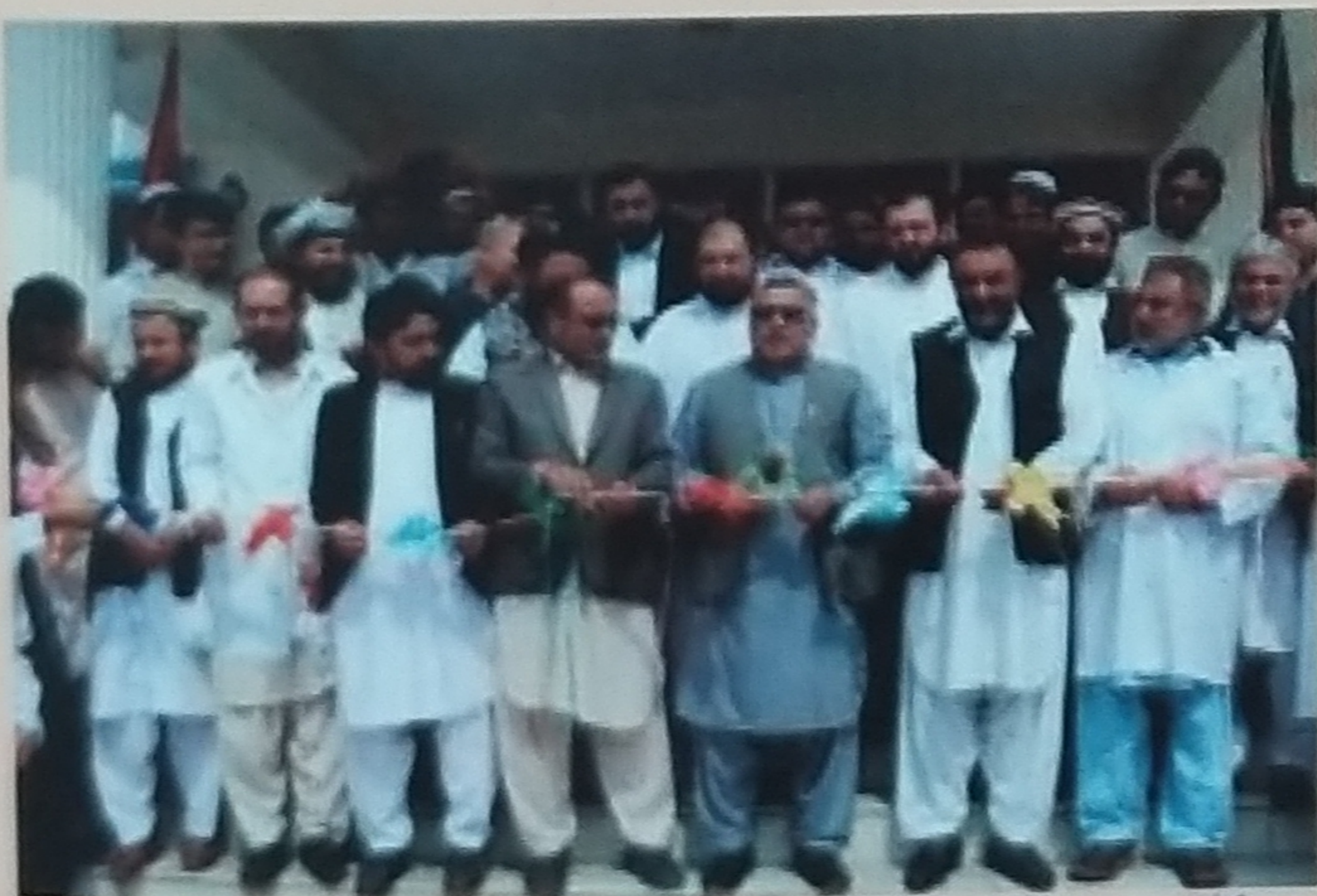
د کادري روغتون پرانسته

○ په کادري روغتون OPD څانگې په فعالیتو سره د مراجعینو په وړاندې پرانېستل.