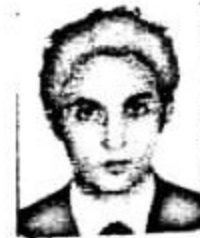
مړسول / President نظام

شرکت خدمات لوژیستیک اسپایر اریا Aspire Aria Logistic Services Co